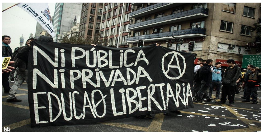
Manifestación Estudiantil / 11 de Abril 2013.

luz de la ciencia, el error del patriotismo y el militarismo y la esclavitud que supone la sumisión ante la autoridad y que las ideas “neutralistas” no preparaban a personas comprometidas con la revolución social y que solamente era una idea pequeña burguesa.