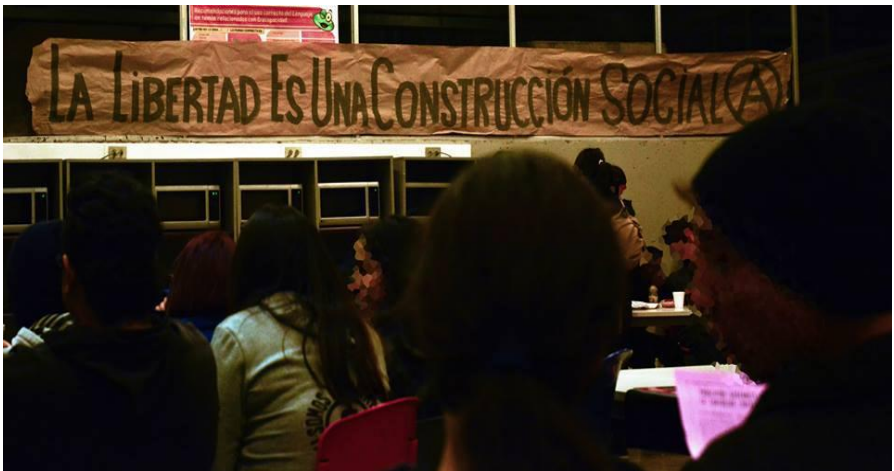
La Libertad es una Construcción Social I: Universidad Central.

Todo esto acompañado de mucha variedad de libros, películas y comida a la venta, al aporte y/o gratis que trajeron diferentes colectivos e individualidades afines. Dejamos la reseña de la película y un artículo muy relevante de educación libertaria.