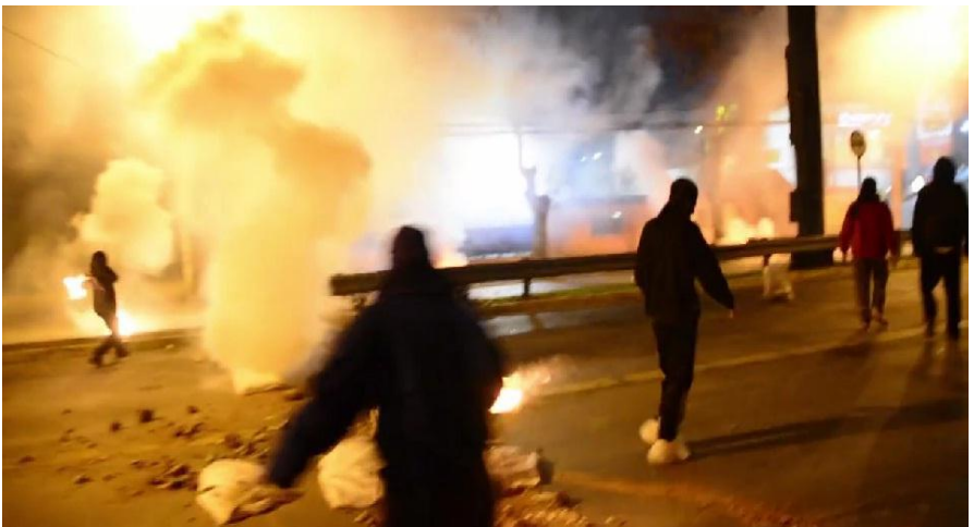
Ataque con bombas molotov desde la UTEM al cuartel de os9 de la policía.

Somos quienes luchamos contra sus instituciones, somos la propaganda armada de igual a igual, por la recuperación y liberación de nuestras vidas y del mundo a manos del Estado/Capital chileno y mundial.