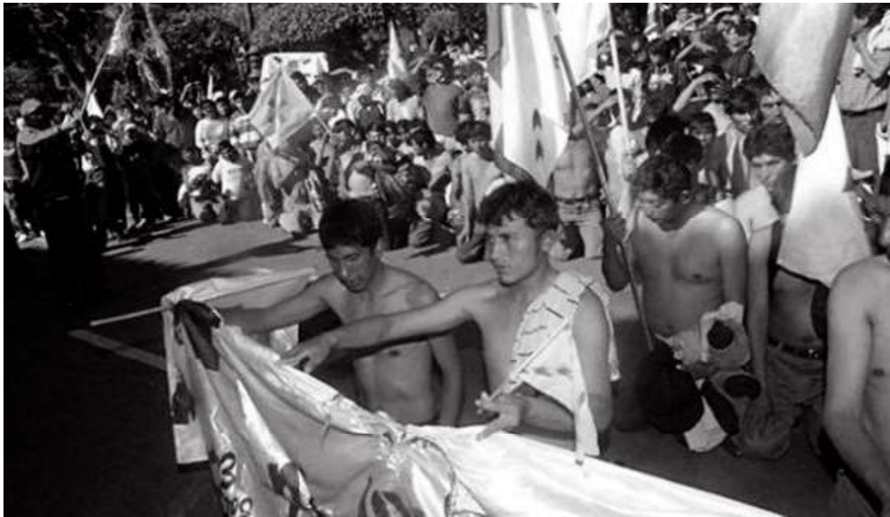
(Foto: indígenas masacrados y obligados a desnudarse por los grupos fascistas en la disputa por la asamblea constituyente. Sucre, 2008)

después de la amnistía de 1979; ambos procesos funcionaron como estrategias pacificadoras 29 y reestablecedoras de los desgastados lazos de la sociedad con el Estado. De forma similar, la Constituyente y la nueva Constitución Plurinacional de Bolivia sirvieron para calmar los ánimos de revuelta que ciertamente no dejaban actuar al Estado desde el 2000. Sin embargo, esa Constituyente y su Constitución construyeron un corral institucional que desvinculó a la gente de la forma autónoma de lucha: la calle y la protesta. La Constituyente redujo luchas milenarias a la sumisión a un partido, el MAS, y permitió que el racismo y el colonialismo se disfrazaran de oposición política para continuar con sus privilegios. Por eso, a los dominadores de siempre, hoy les resulta más fácil insultar un indio, llamándolo “masista”, que manteniendo el clásico “indio de mierda” que resulta muy políticamente incorrecto. En el fondo, detrás del calificativo despectivo de “masista” está implícito la doble ofensa de indio y sumiso.